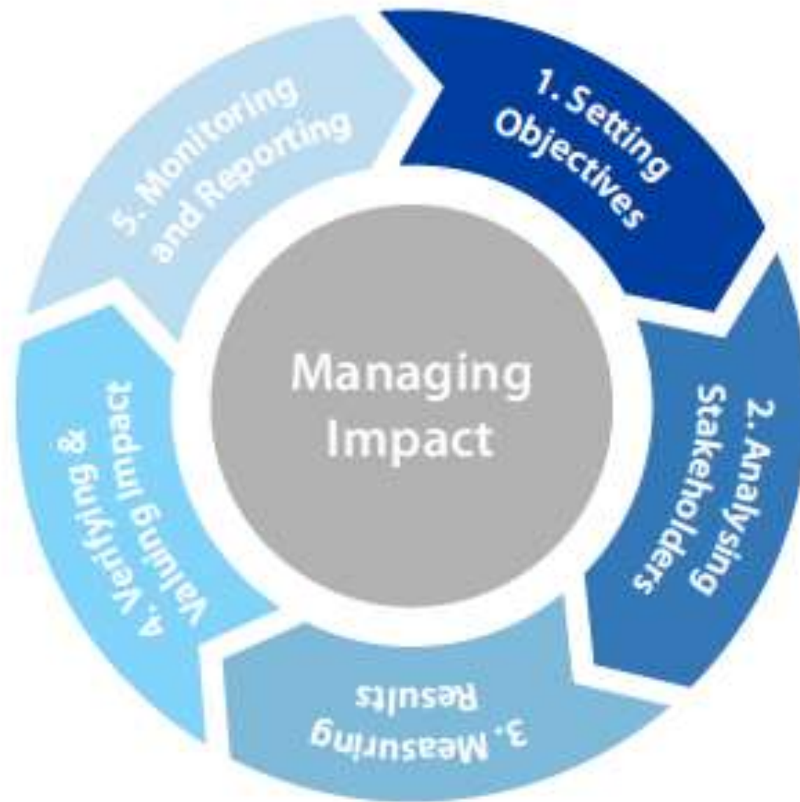
Figure 3: The EVPA five-step impact measurement process